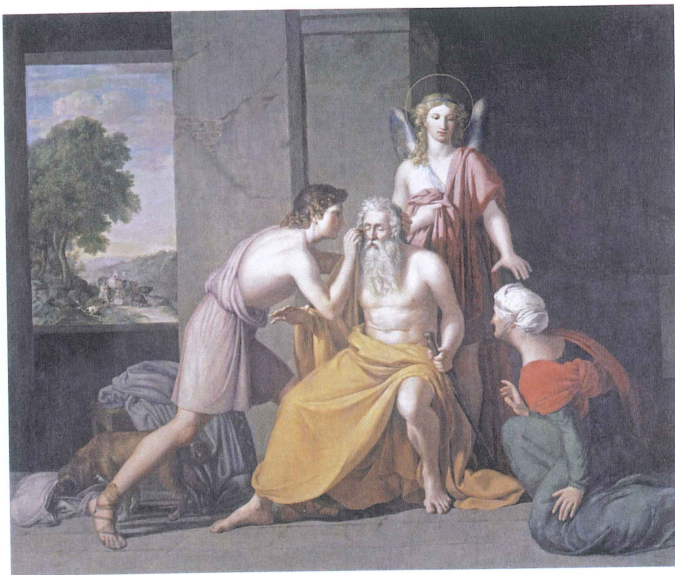
Rafael Tejero: Curación de Tobías.